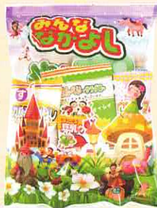
■合掌タイプ ヨコ 180× タテ 240 mm