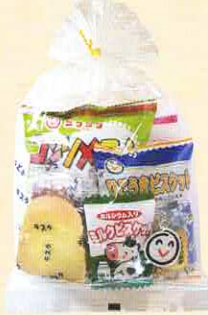
■巾着タイプ ヨコ 180× タテ 320 mm