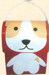
■化粧箱 巾 111× 奥行 76× 高 137+ 取手 42 mm