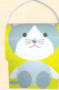
■化粧箱 巾 111× 奥行 76× 高 137+ 取手 42 mm