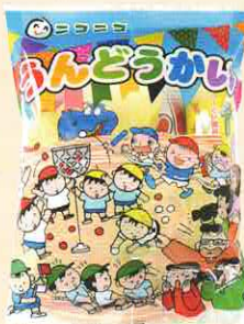
■合掌タイプ ヨコ 180× タテ 240 mm