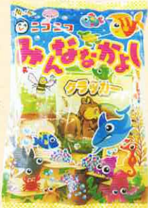
■合掌タイプ ヨコ 200× タテ 290 mm