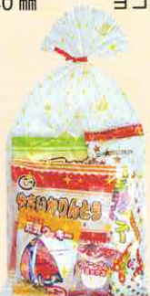
■巾着タイプ ヨコ 140× タテ 300 mm