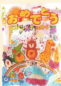
■合掌タイプ ヨコ 180× タテ 240 mm