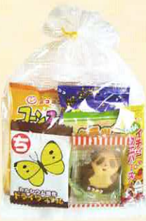
■巾着タイプ ヨコ 200× タテ 350 mm